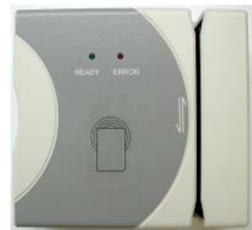
Lector híbrido Alocan Mag+Prox