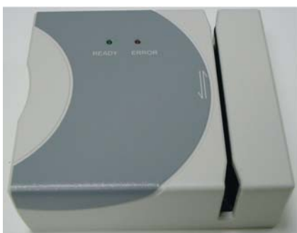
Lector magnético Alocan Mag

Es posible su integración en equipos con carcasa, ejemplo: