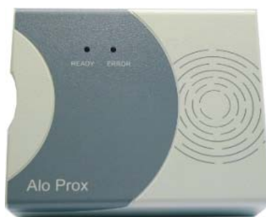
Lector de proximidad Alocan Prox