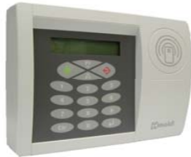
Caja BioMax 2 con Prox