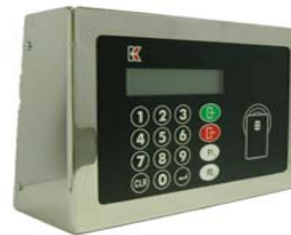
Caja Inox Prox con Mifare