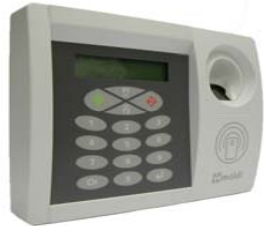
Caja BioMax2 IP con Prox

(**): Somos expertos en venta DEM para marca blanca, consultanos las posibilidades de acabado personalizado.