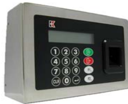
Caja Inox IP