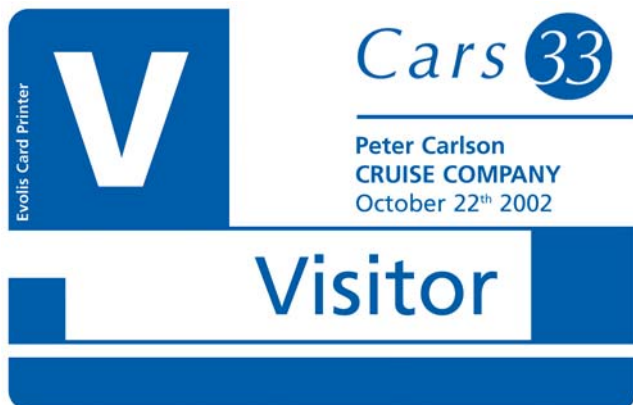
Tarjeta de visitante

La impresora Tattoo es una impresora ideal para congresos y eventos: personaliza una tarjeta en pocos segundos y la deja en posición para recoger.