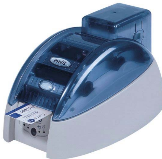
Impresora de tarjetas Tattoo

La impresión de las tarjetas es inmediata y podemos entregar una tarjeta personalizada en pocos segundos. La impresora puede imprimir la tarjeta a todo color o trabajar con tarjeta pre-impresa y personalizar los datos variables en monocromo.