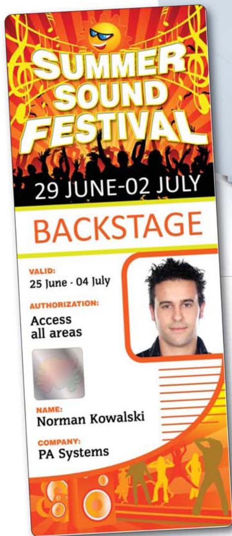
TARJETA CR80 ESTÁNDAR