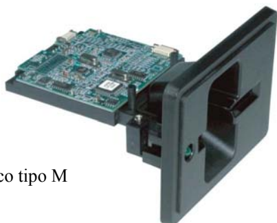
Frontal metálico tipo M