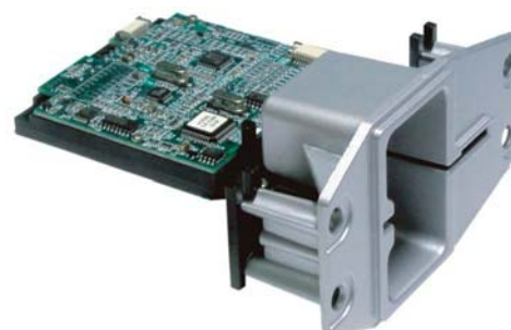
Frontal metálico tipo Flush