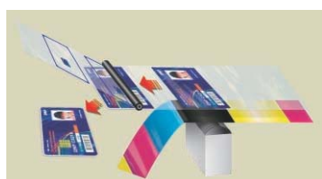
Processo de impressão re-transferência