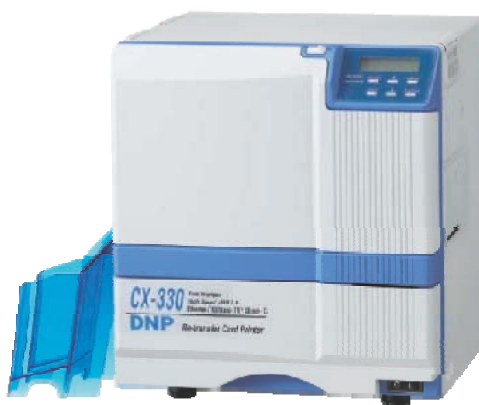
CX-330 impressora por re-transferência