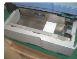
Alimentador de cartões